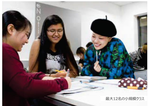
最大12名の小規模クラス

一般英語 (20/30) ビジネス英語入門 (20+10) シティー体験英語 (20+10) ミニグループ (20/30) アカデミックイヤー (20/30) ケンブリッジ英検対策 (20/30) Higher Score® IELTS/TOEFL (30) 個人レッスン クラブ50+: ミニグループ (20)