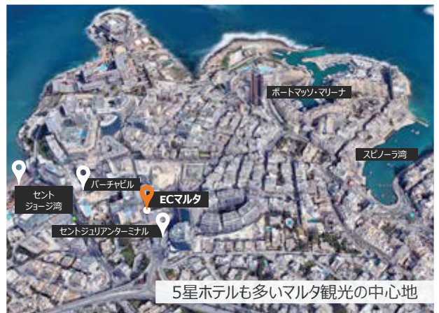
5星ホテルも多いマルタ観光の中心地

各校の学校情報は2018年の情報に基づくもので、今後予告なしに変更になる場合があります/国籍データは2017,2018年のデータに基づいています/通学手段は代表的なものが記載されています