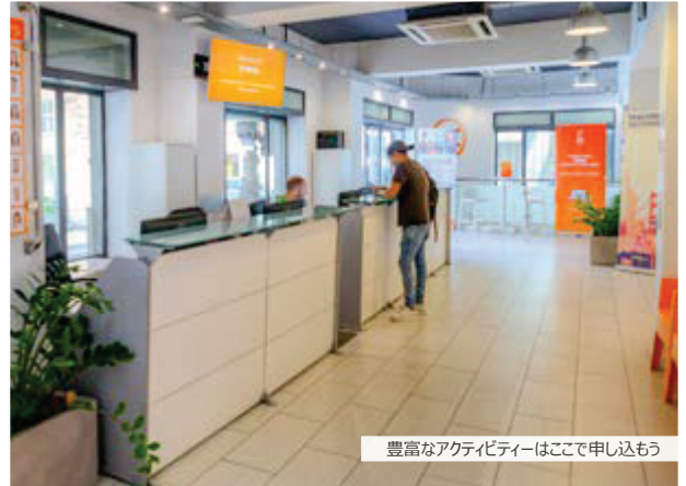
豊富なアクティビティーはここで申し込もう