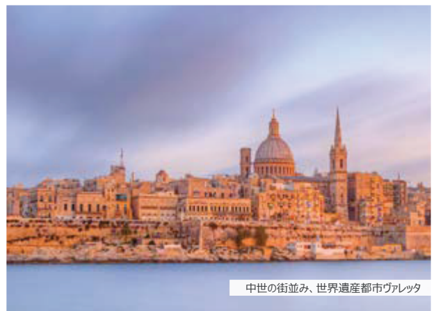
中世の街並み、世界遺産都市ヴァレッタ

ECインターナショナルパーティー ヨガレッスン ポパイビレッジ ワインテイasting 夜景ツアー マルタ1日クルーズ 週末ゴゾ島ツアー 週末シチリア島ツアー