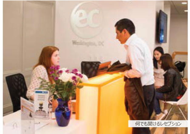
何でも聞けるレセプション