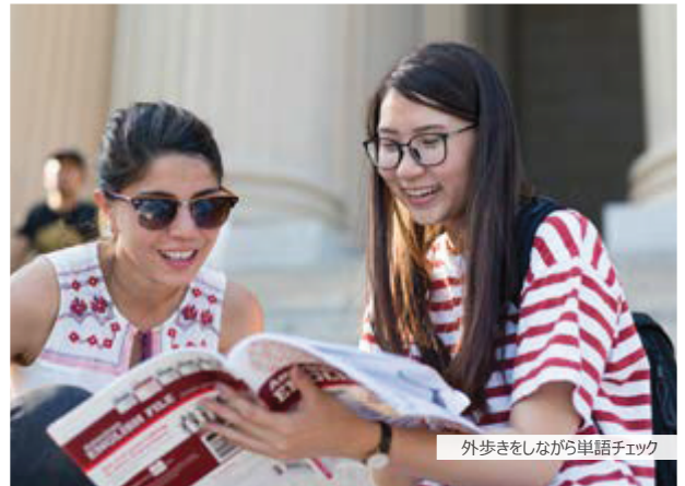
外歩きをしながら単語チェック