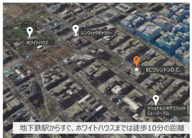
地下鉄駅からすぐ、ホワイトハウスまでは徒歩10分の距離