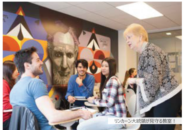
リンカーン大統領が見守る教室！